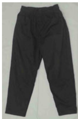
黒色長ズボン (GU製、Lサイズ)