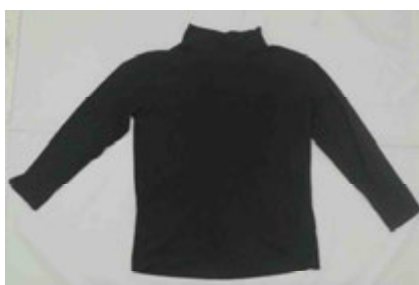
黒色タートルネックシャツ (Lサイズ)