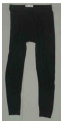
黒色パッチ (イオン株式会社製)