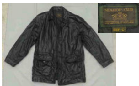
黒色革製コート (SEAHOP CLUB製、Lサイズ)