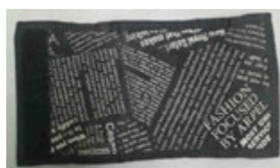
黒色布製二つ折財布