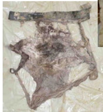
パンツ (サイズL、ユニクロ製)