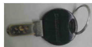
自転車の鍵 (ブリジストン)