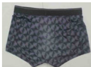
トランクス (SUNNYS製、Lサイズ)