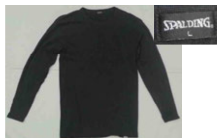
黒色長袖シャツ (SPALDING製、Lサイズ)