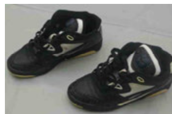
黒色スニーカー (SPALDING製、25.5cm)