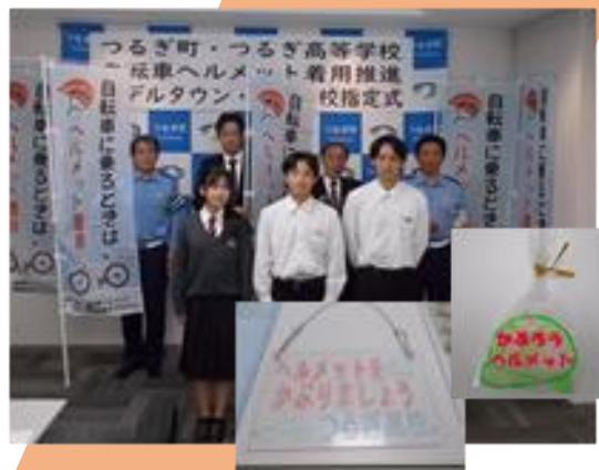
自転車ヘルメット着用推進モデルタウン・モデル校指定