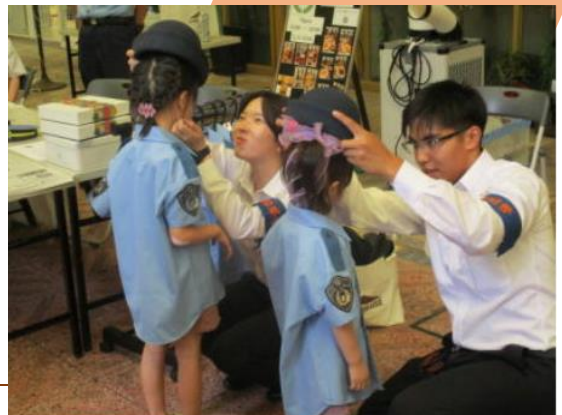
おしごとキッズマルシェ

「将来、警察官になりたい」と夢を抱いてくれる子どもが一人でも増えるよう、今後も様々なイベントを通じ、警察の魅力を発信してまいります。