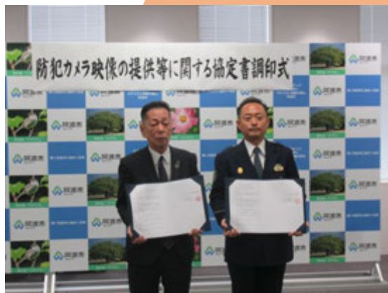
防犯カメラ映像の提供等に関する協定の締結

事件事故発生の際に、防犯カメラ映像の提供が迅速に行われ、早期検挙へと繋げていけるよう、今後も連携を図ってまいります。