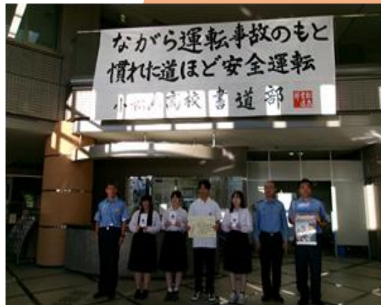
高校書道部とコラボした交通安全啓発の取組

今後も悲惨な交通事故を無くすため、交通ルールの遵守や交通事故防止を呼びかける、地域に密着した取組を推進してまいります。