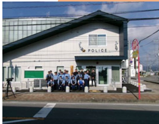
藍住町交番運用開始

また、交番が藍住町役場敷地内に整備されたことにより、DVや児童虐待の被害者支援、災害対応等で自治体と迅速かつ緊密な連携が可能となりました。