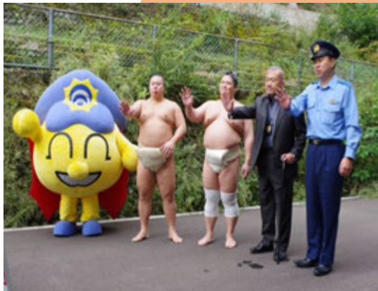
「令和六年秋巡業大相撲那賀場所」における暴力団追放・特殊詐欺被害防止キャンペーン

相撲の決まり手「押し出し」にならい、阿南警察署は地域に巣食う「悪」を徹底的に押し出し、地域の安全安心を実現できるよう、努めてまいります。