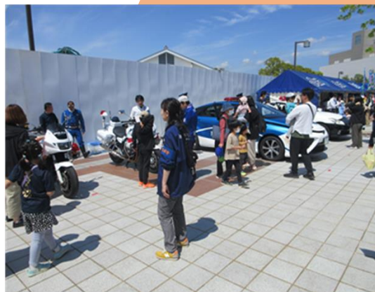
徳島ヴォルティスホームゲームでの広報啓発活動

今後も、大規模イベントに積極的に参加して効果的な広報啓発活動に取り組んでまいります。