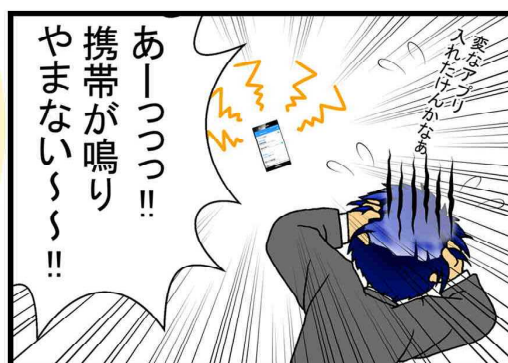
※ 「携帯が鳴りやまない」のは、影響の一例です。

徳島県警察 サイバー犯罪対策室 サイバー犯罪相談専用電話 フィッシング110番 088-622-3180